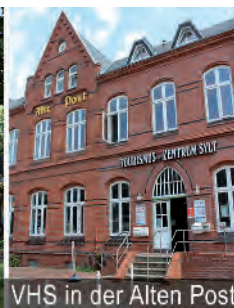
VHS in der Alten Post