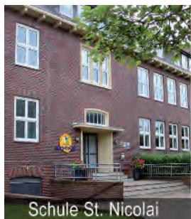
Schule St. Nicolai